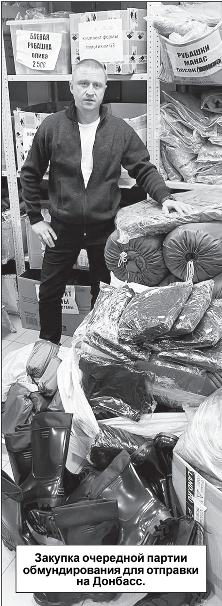
Закупка очередной партии обмундирования для отправки на Донбасс.