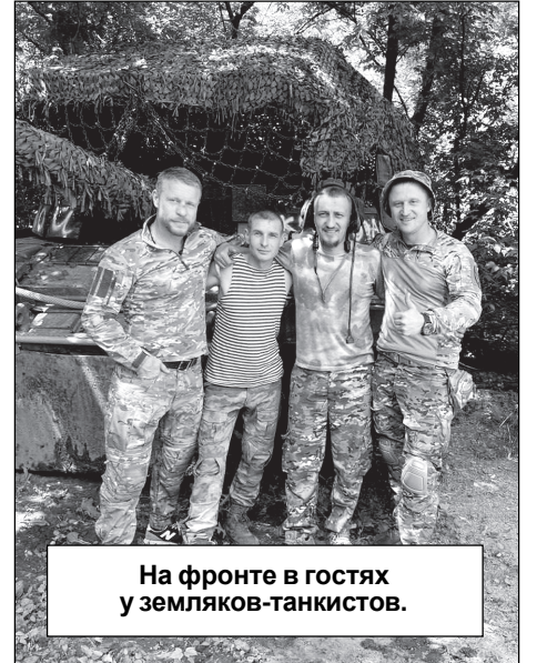
На фронте в гостях у земляков-танкистов.