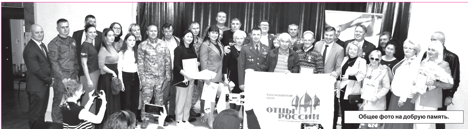
Общее фото на добрую память.