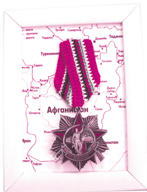
Светлана Назарова. (Прикладное искусство)