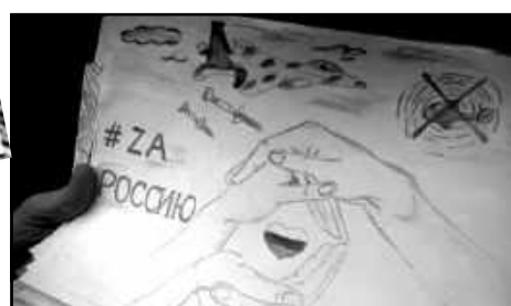
Наши бойцы передают большой привет тимашевцам и всем, кто их поддерживает. Посылки доставлены! #МыВместе!